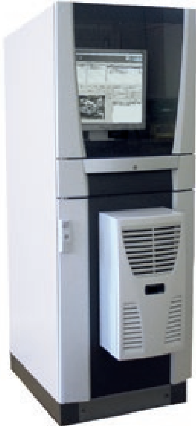
PC-Schranksystem (STAMA Nr. 3303)