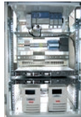
Beispiel für Innenansicht