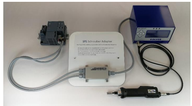
Anbindung eines Kolver-Steuergeräts an eine SPS (STAMA Nr. 3893)