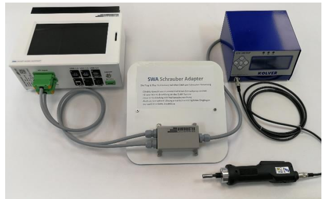
Anbindung eines Kolver-Steuergeräts an einen Smart Work Assistant (STAMA Nr. 3890)