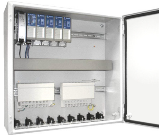
Beispiel für Innenansicht (STAMA Art. Nr. 3271)