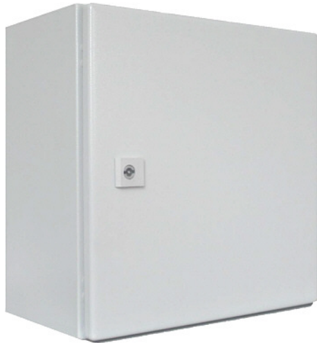
380x380x210 mit Blechtür (STAMA-Artikel-Nr.: 3270)