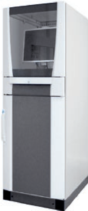
Gesamtansicht (STAMA Nr. 3302)