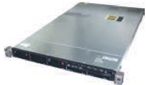
oder Server HP erhältlich (STAMA Nr. 3121)