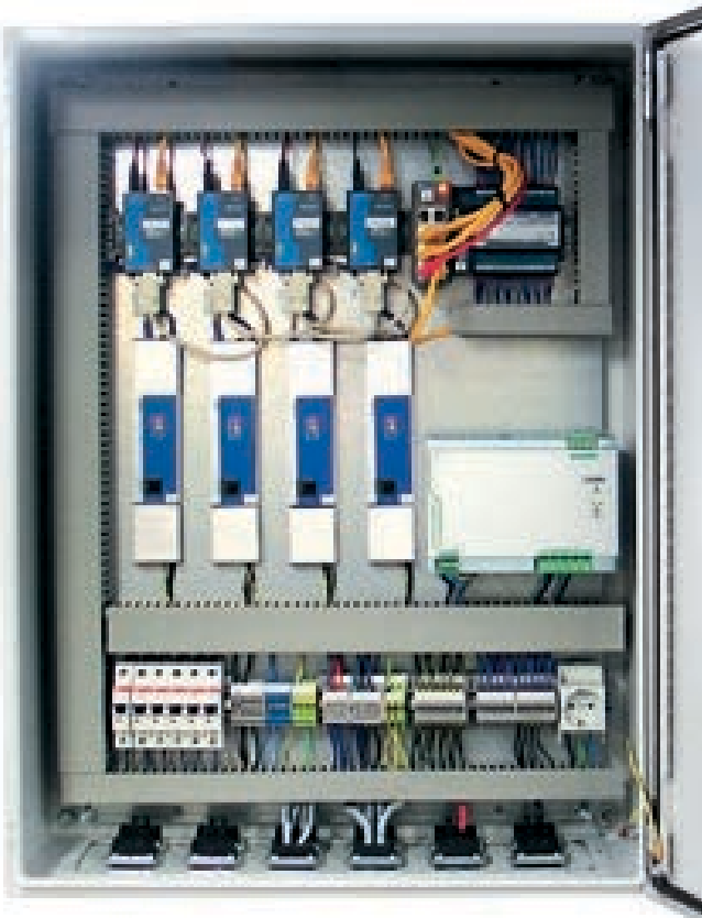
3D-Zeichnung: Schematischer Aufbau

Komplett ausgestattete Connector-Box für die Kommissionierung