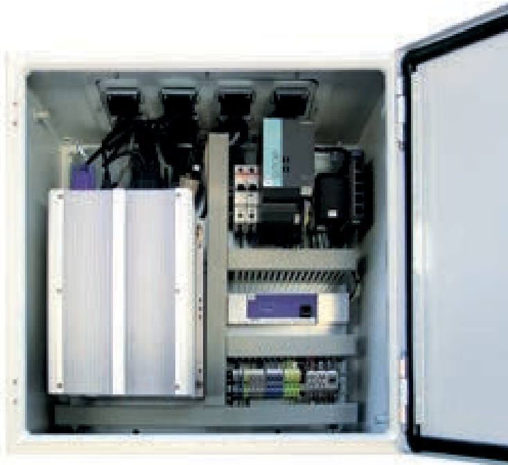
Klemmkasten mit eBox-PC 3063 und Pick to Light-Controller (STAMA Nr. 3279)

Komplett ausgestatteter Klemmkasten für Werkerführungen