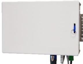
Smart Work Assistant Client - ohne Display (STAMA-Nr. 3289)