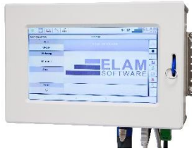
Smart Work Assistant Client (STAMA-Nr. 3288)