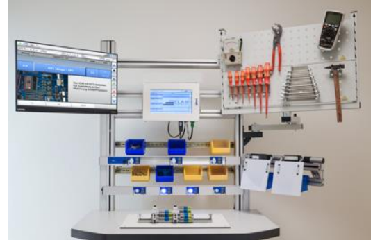
SWA im Einsatz mit Anbindung eines Monitors, Pick to Light und Sensorik über Ein- und Ausgänge