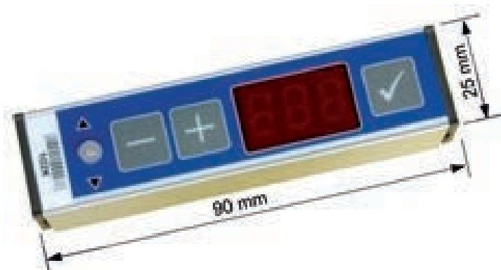
Anzeigemodul Slim-Line mit Zahlendisplay S3N-1 (STAMA Nr. 3627)