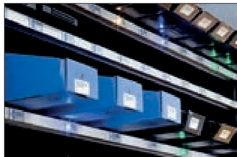
Anwendungsbeispiel Slim-Line SL-1